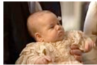
Bilder der Woche