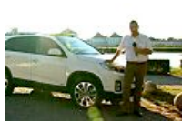
Fahrbericht: Kia Sorento