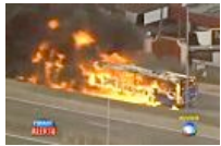
Krawalle nach Tod eines 17-Jährigen